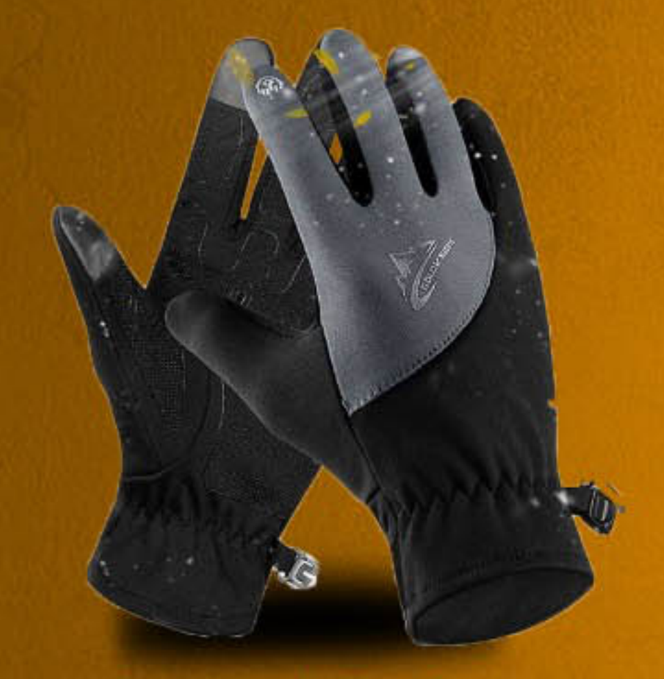
Guanti € 34,00