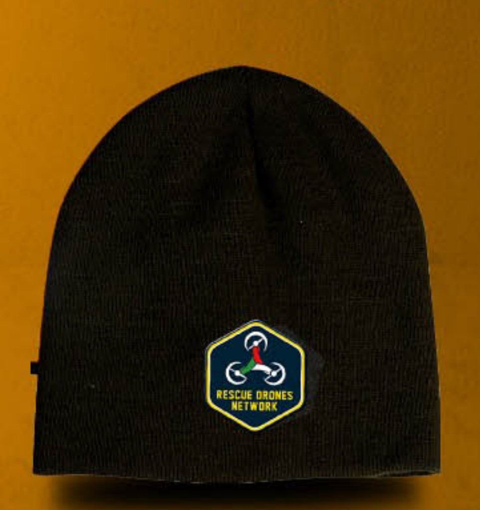
Berretto invernale € 9,00